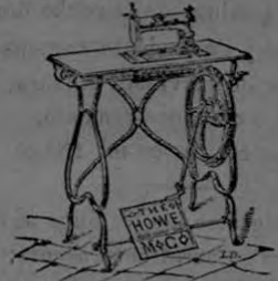
TIPO DE LA Verdadera Elias Howe

Las unicas que han obtenido siempre las mas altas recompensas en todas las exposiciones universales desde 1862